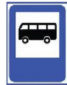
МЕСТО СТОЯНКИ АВТОБУСА, ТРОЛЛЕЙБУСА