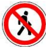
3.10 Движение пешеходов запрещено