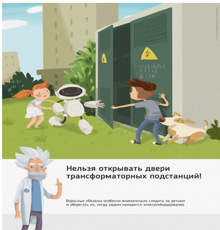
Рис.1 Нельзя открывать двери трансформаторных подстанций

Ежегодно энергетики проводят для школьников познавательные уроки, конкурсы рисунков и историй на тему электричества и правильного с ним обращения. Но работы одних энергетиков в данном направлении недостаточно, для полного понимания проблем электробезопасности нужен пример общества, в котором растет ребенок, и, конечно же, главным образом родителей. Эта работа приносит свои результаты: электротравмы на энергетических объектах единичные, и каждый случай становится поводом для служебной проверки. Но только технических мер мало для того, чтобы полностью обезопасить детей. Им нужен пример родителей.