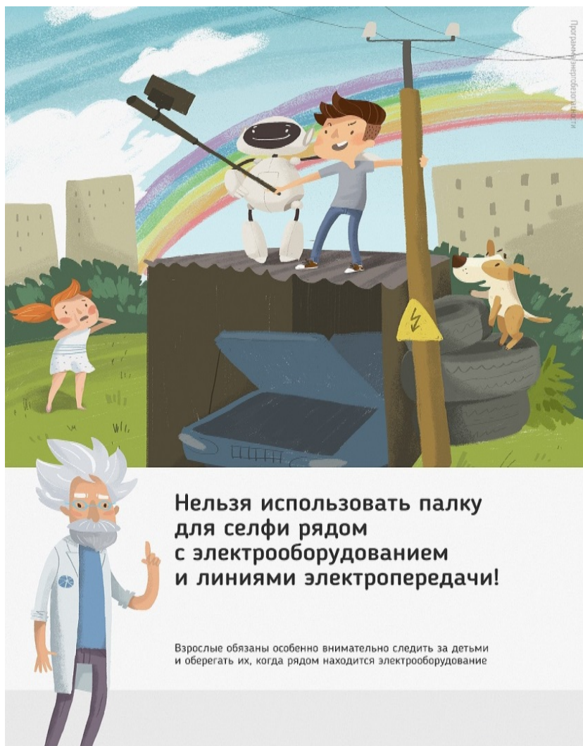
Рис 2. Нельзя использовать палку для селфи рядом с электрооборудованием и линиями электропередачи

Ну и, наконец, нужно повторить с ребенком алгоритм действий в экстремальной ситуации. Проверьте, умеет ли он набирать на сотовом телефоне телефон экстренных служб. Изучите с ним вещества и предметы, которые хорошо проводят электрический ток и потому особенно опасны, и, наоборот, вещества и предметы, плохо проводящие электрический ток и полезные в экстремальной ситуации.