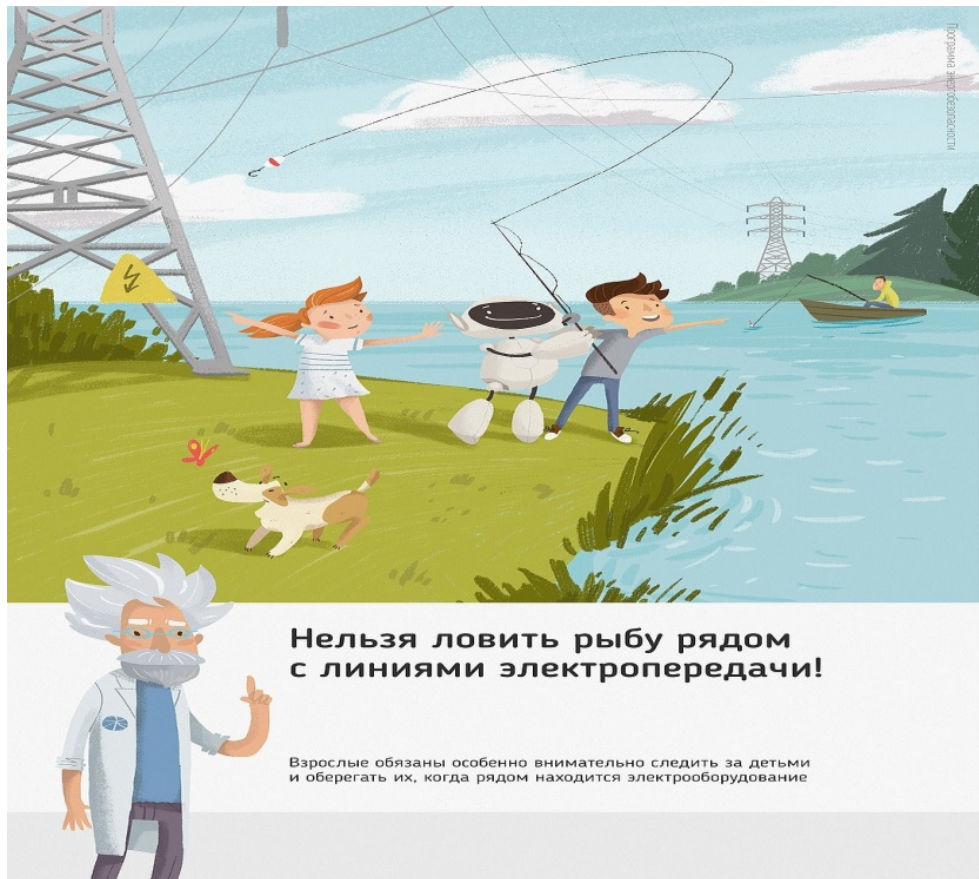
Рис. 4 Нельзя ловить рыбу рядом с линиями электропередачи